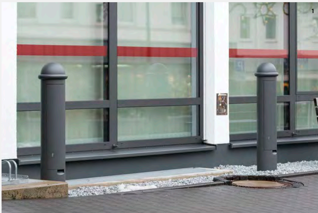
1 VERSORGUNGSPOLLER 300-2