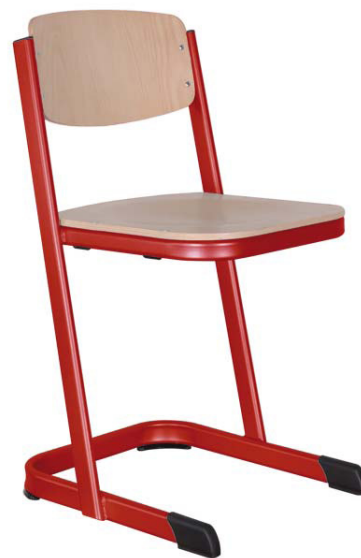
Schulstühle U-Form, geschlossener Sitzträger