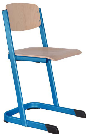
Schulstühle U-Form, offener Sitzträger