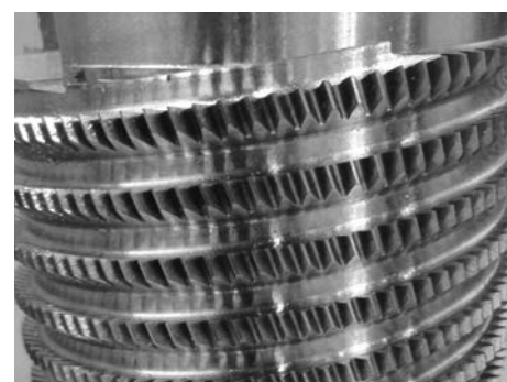
Werkstück mit verdrahter Spannutt