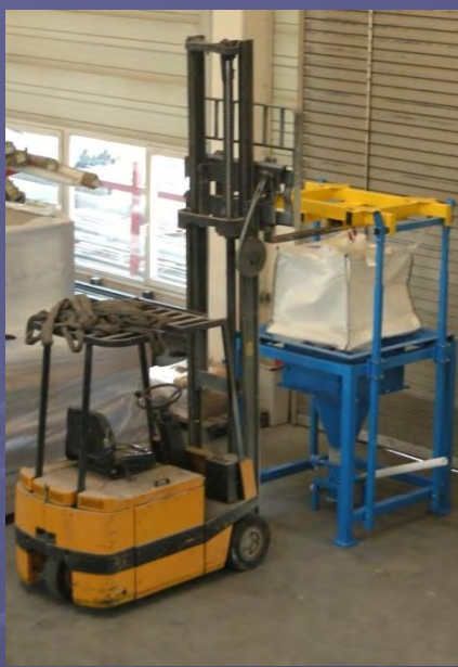
Beladung der Station mittels Gabelstapler