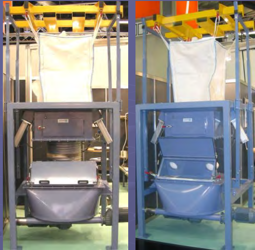
Kombiniert mit Sackaufgabe