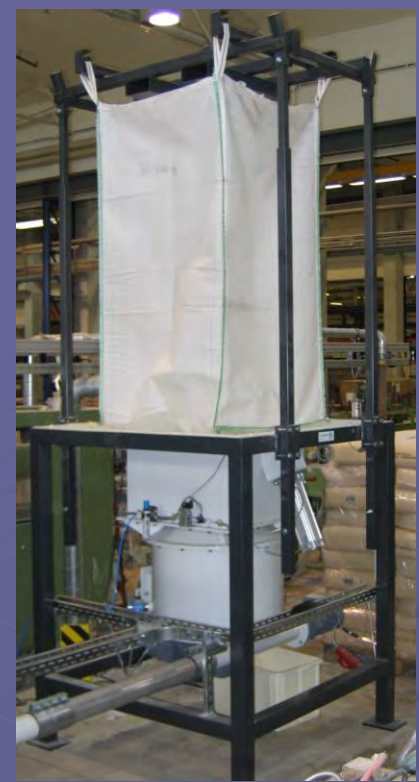
Entleerstation mit kombiniertem Austrags- und Dosiergerät