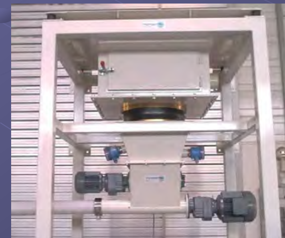
Entleerstation mit Behälter Typ FW und horizontalem Auflockerungssystem sowie Dosierer