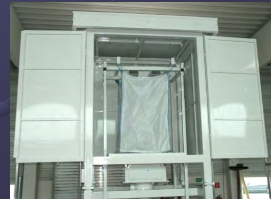
Entleerstationen mit Umhausung