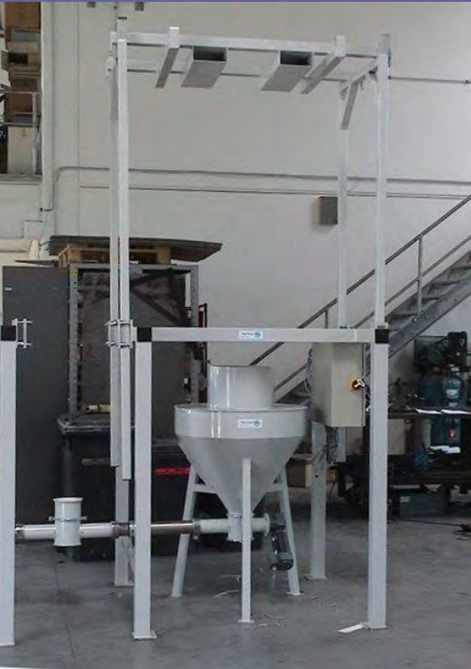
Entleerstation mit separatem Aufnahmetrichter und Spiralförderer