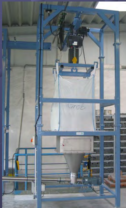
← ↑ Beladung der Station mittels integrierter Laufkatze zum Anheben und Hineinfahren der Big Bags