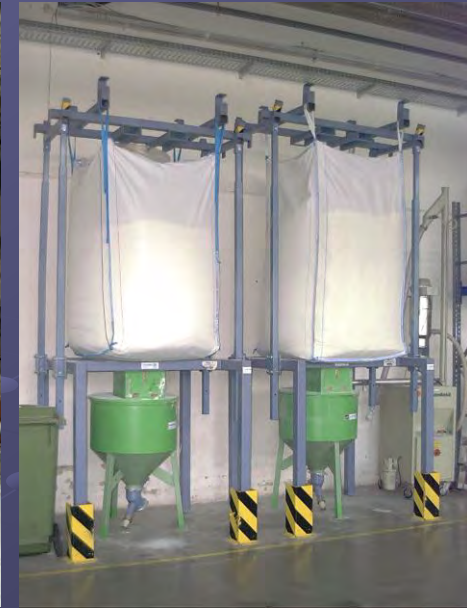
Entleerstationen mit nachgeschalteten Spiralförderern