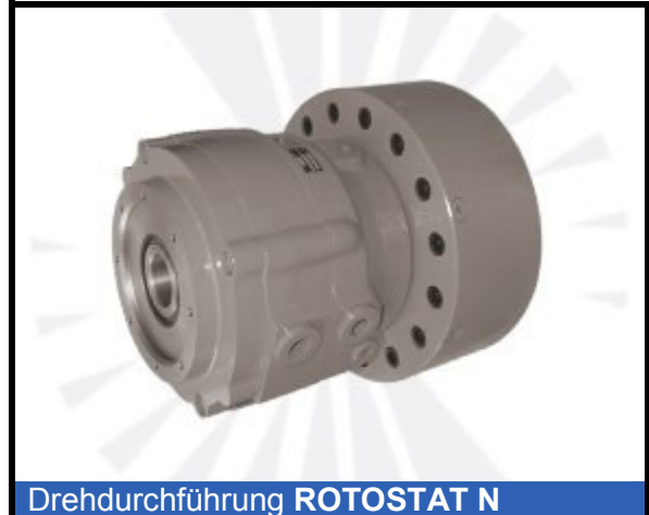
Drehdurchführung ROTOSTAT N