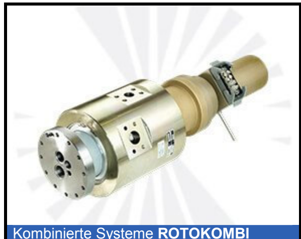
Kombinierte Systeme ROTOKOMBI