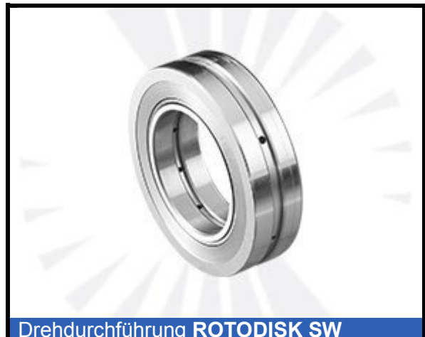
Drehdurchführung ROTODISK SW