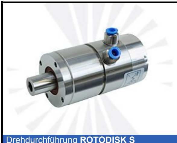
Drehdurchführung ROTODISK S