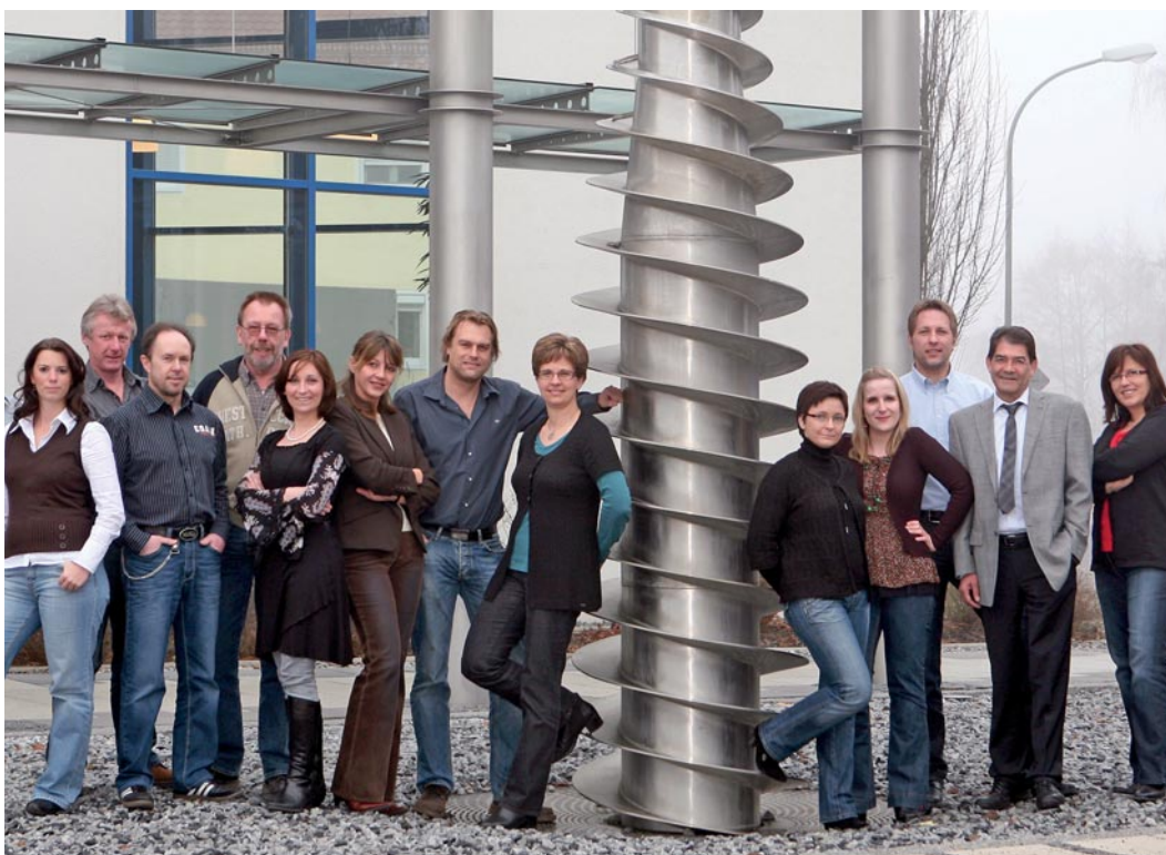
Ihr Flottweg Service-Team in Vilsbiburg