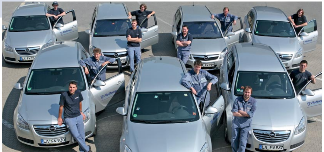
Die Flottweg Servicetechniker stehen stets für Sie bereit

Die Adressen der Flottweg Servicestationen aller Auslandsniederlassungen finden Sie auf unserer Website www.flottweg.com .