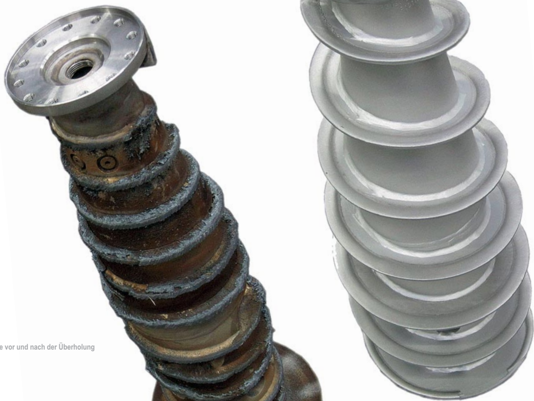
Schnecke vor und nach der Überholung

Nutzen Sie das Know-how und die Möglichkeiten des Herstellers.