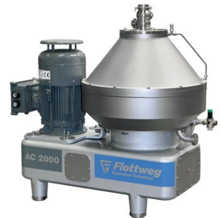
Dekanter, Separatoren und Bandpressen lassen sich von Flottweg mieten.