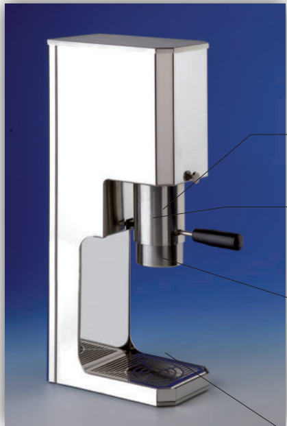
Eispresse Modell 180P

Druckplatte bestückt mit einem Links-Gewinde zum einfachen Abnehmen und Reinigen