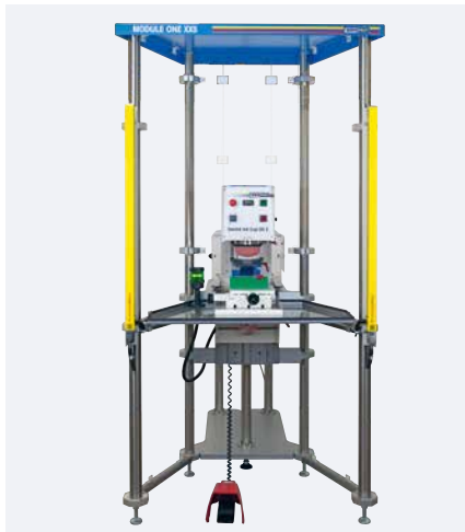
MODULE ONE XXS mit Tampondruckmaschine SEALED INK CUP 90 E

Die MODULE ONE XXS besteht grundsätzlich aus einem kompakten Gestell, einer Schutzumhausung sowie den drei standardisierten Bauteilen: Lichtvorhang, Winkeltisch und Kreuzsupport.