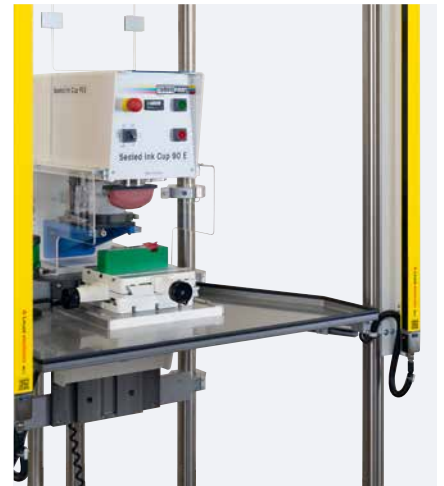
Winkeltisch mit Ablagefläche

Ein stufenlos höhenverstellbarer Winkeltisch ermöglicht die Bedruckung verschieden hoher Druckteile.