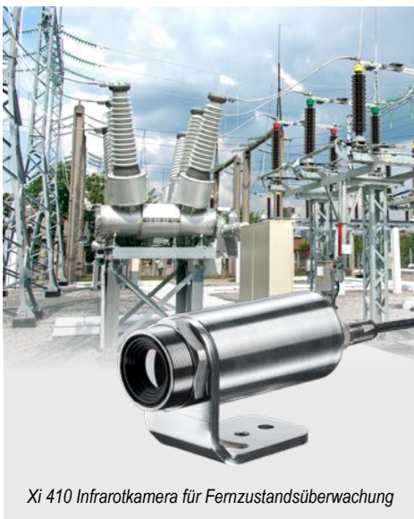
Xi 410 Infrarotkamera für Fernzustandsüberwachung