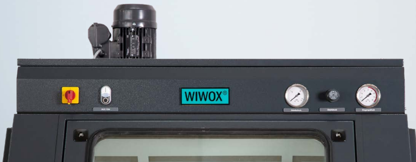
Bedienpanel an der Anlagenfront