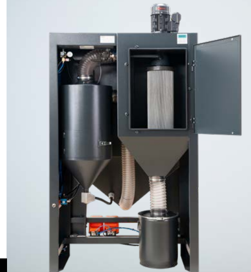
Injektorstrahlen mit mineralischen Strahlmitteln