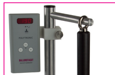
Temperaturregler mit Aufhängevorrichtung für Siegelkopf

Das Gerät erfüllt die grundlegenden Anforderungen der Richtlinie 2006/95/EG (Niederspannungsrichtlinie).