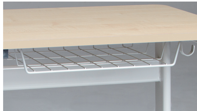
Drahtkorbbablage als Zubehör bestellbar