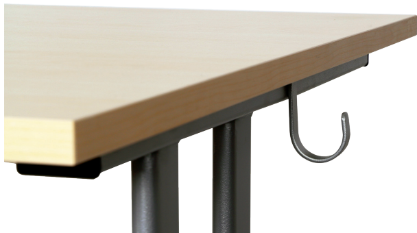
Taschenhaken als Zubehör bestellbar