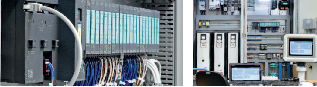
Individuell angepasste Lösungen stehen in unserem Testcenter auf dem Prüfstand