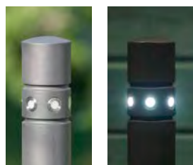
Poller 008 auch als LED-Poller erhältlich (s. S. 073: Leuchtpoller 240 LED)