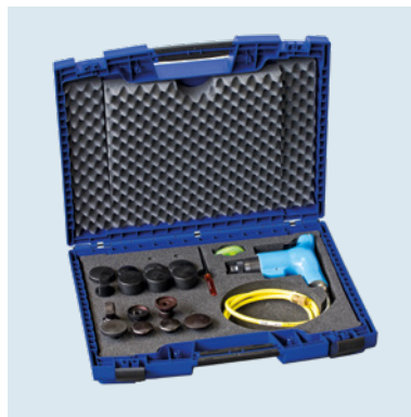
GL 2 MAX KIT 3 Alles in einem Koffer. Everything in one box.