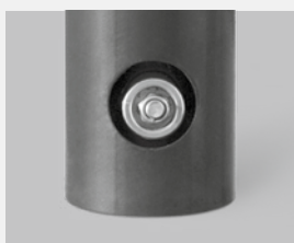
Der einzige Pollerascher mit integrierter Sollbruchstelle