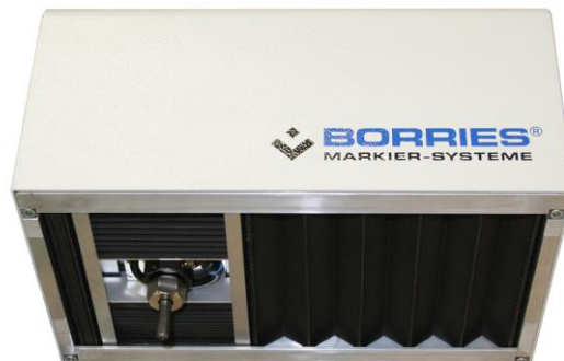
322 mit Faltenbalg