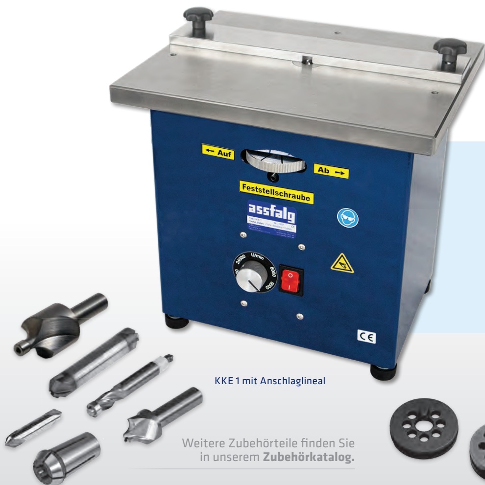
KKE 1 mit Anschlaglineal

Weitere Zubehörteile finden Sie in unserem Zubehörcatalog .