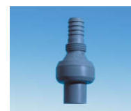
Rückschlagventil entlüftet vented non- return-valve 3004.53.00