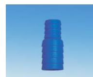
Entlüftungsstutzen vent connection C1.0605.01