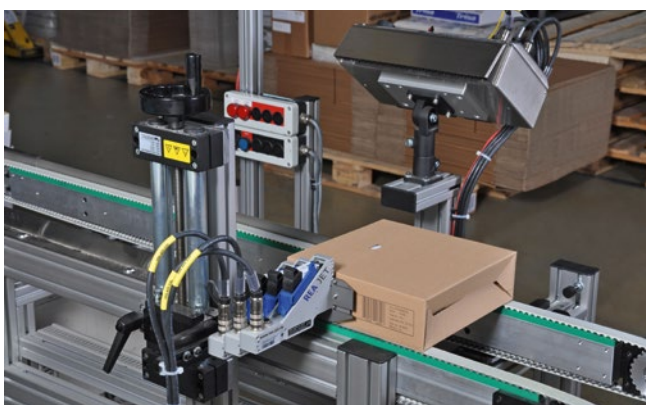
HR pro in Verpackungslinie integriert