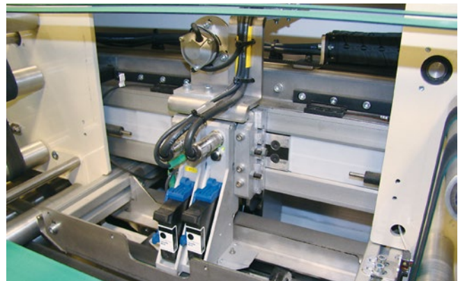
HR integriert in Kuvertiermaschine