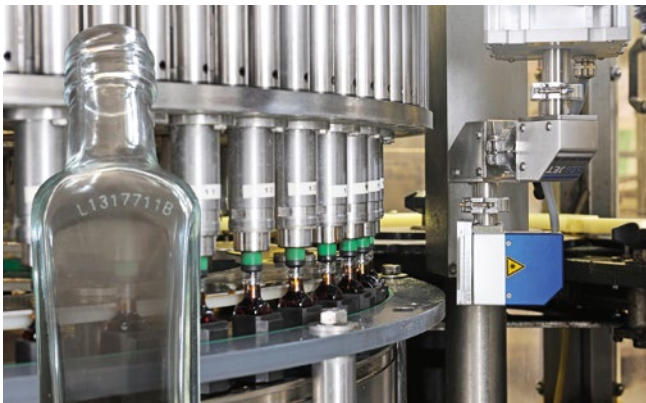
Glaskennzeichnung mit CO 2 Laser CL IP65