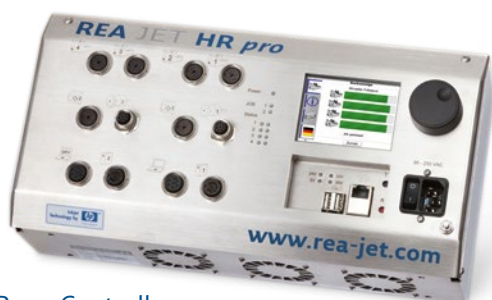
HR pro Controller für den Schaltschrankbau, bis zu 4 Schreibköpfe