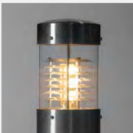
LED, Edelstahl, Acrylglas klar