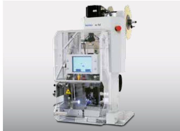
▲ Komax bt 722 Standard

Die Leiter können mit unterschiedlichen Crimphöhen und Crimpkraftüberwachungen gefertigt werden. Der Maschinenbediener wird visuell durch die Fertigung des Mantelkabels geführt.