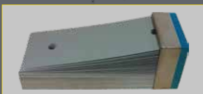
BSM 1 - Typ 92. und PSC...