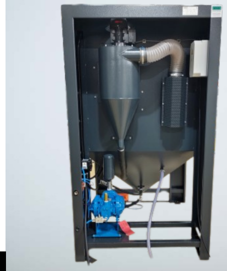
Strahlen mit mineralischen Strahlmitteln