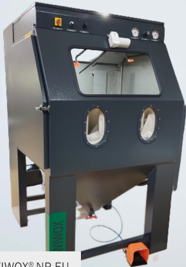
Nassstrahlkabine WIWOX® NP-EU

Oberflächenbearbeitung mit mineralischen Strahlmitteln.