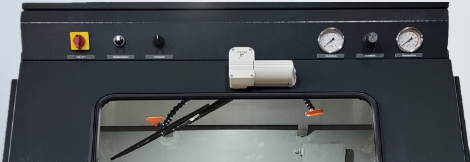
Anlagenfront mit übersichtlichem Bedienpanel