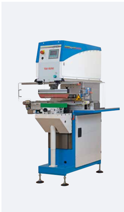
TSM 60/90 universal Querrakelkit

Ausführungen mit servomechanischem Antrieb zeichnen sich durch sehr hohe Taktzahl und sehr hohe Druckkraft aus. Energieeffizienz bei der Kinematik von Rakel- bzw. Tamponbewegung sowie ressourcenschonender Maschinengestellaufbau runden das gelungene Maschinenkonzept ab.