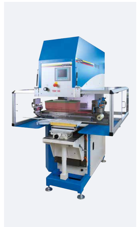
TSM 130 universal Querrakelkit