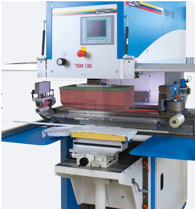
TSM 130 universal Querrakelkit mit Restfarbenabholung (Option)