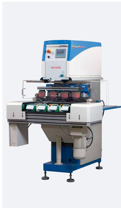
TSM 60/90 universal Mehrfarbenkit Solo