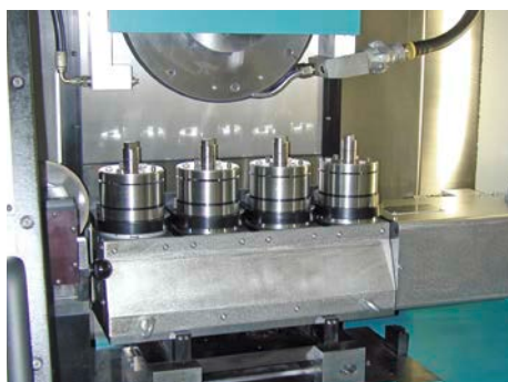
Bearbeitungsraum mit Spannvorrichtung