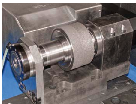
Abrichter mit Profilrolle