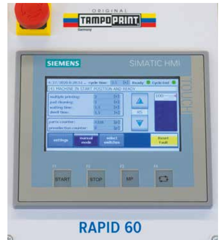
Moderne Bedienung über benutzerfreundliches Touchdisplay

Die RAPID-Baureihe ist mit nützlichen, praktischen und zusätzlichen Erweiterungen für