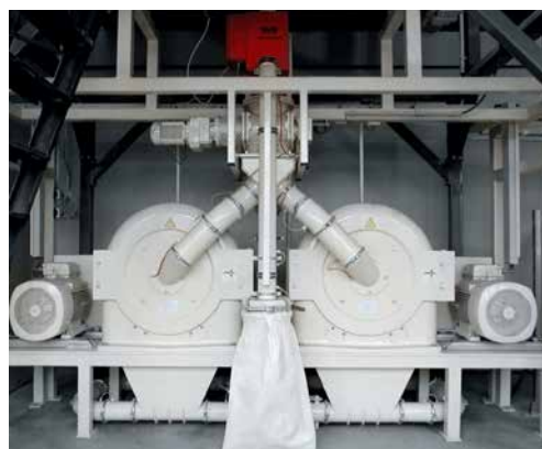
REKORD C Kombination für Lebensmittelproduktion