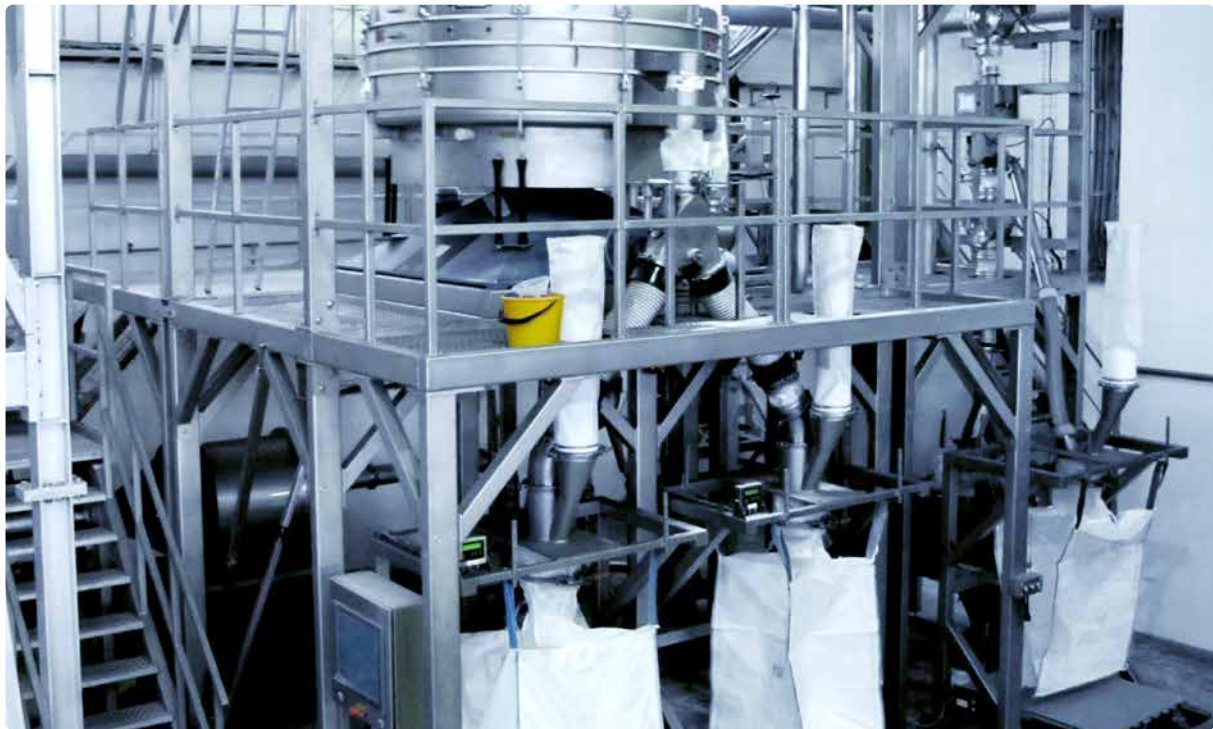
REKORD C Mahlanlage für Lebensmittelphosphate