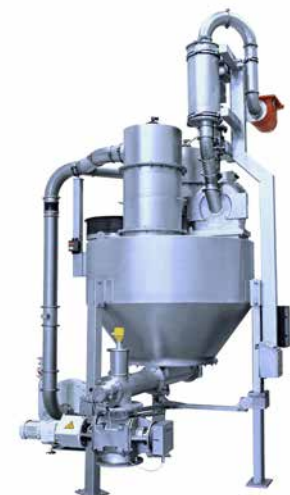
REKORD BT-ex ATEX-konforme Universalmahlanlage