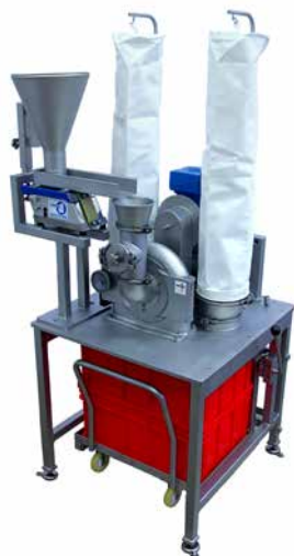
REKORD A Tischmühle für kleinere Chargen