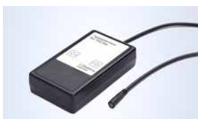
Tipptastenbox (für Option T, nicht für PSW)