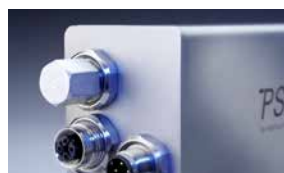
Schraubkappe zum Abdecken des zweiten Busanschlusses (für PSS/PSW)