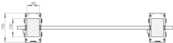
JFB 3 K | Bestell-Nr. 08 031 085-V | Draufsicht JFB 3 K | Order No. 08 031 085-V | Top view