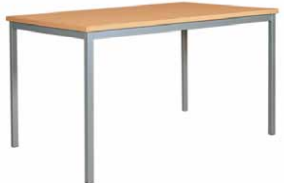
Mehrzwecktische mit Vierkantbeinen

dreieckig: 113 x 80 x 80 cm | 120 x 85 x 85 cm | 127 x 90 x 90 cm