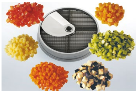
Würfel (W) • Cubes (W) • Cubetti (W)

W6 6×6×8 mm W10 10×10×10 mm W8 8×8×8 mm W14 14×14×14 mm