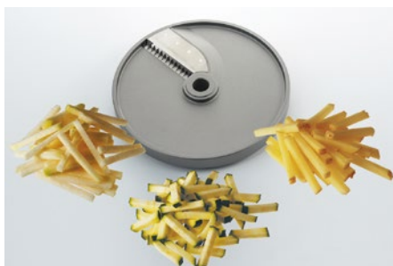
Bâtonnets (BT) • Bastoncini (BT) • French fries (BT)