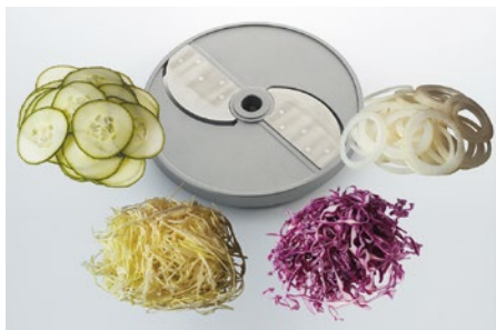
Feinschnitt (F) • Tranches fines (F) • Taglio fine (F) • Fine cut (F)

Le programme des disques • Our range of cutting discs • L'assortimento dei dischi da taglio