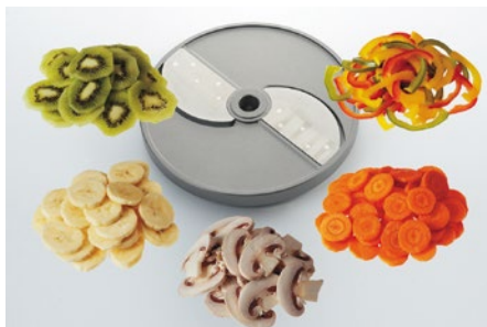
Grobschnitt (G) • Tranches épaisses (G) • Taglio grosso (G) • Coarse cut (G)

G3 3 mm G6 6 mm G10 10 mm G4 4 mm G8 8 mm G12 12 mm G16 16 mm