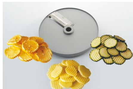
Demidov (SU) • Wave cut (SU)

W6 6×6×8 mm W10 10×10×10 mm W8 8×8×8 mm W14 14×14×14 mm