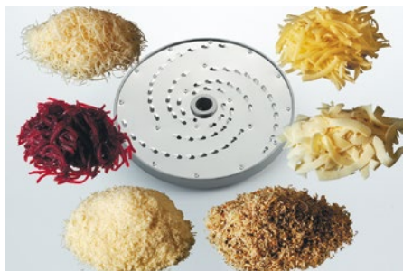
Raffel (RS) • Râpe (RS) • Grattugia (RS) • Shredding (RS)

No. 000 13 mm No. 7 3 mm No. 18 Fondue No. 00 11 mm No. 9 2,5 mm 12 mm No. 0 9 mm No. 11 2 mm No. 1 7 mm No. 12 1,8 mm No. 19 Fondue No. 2 6 mm 16 mm No. 3 5 mm No. 14 Parmesan, No. 23 Universal, No. 4 4,2 mm Parmigiano Universelle, Universale 2,5 mm