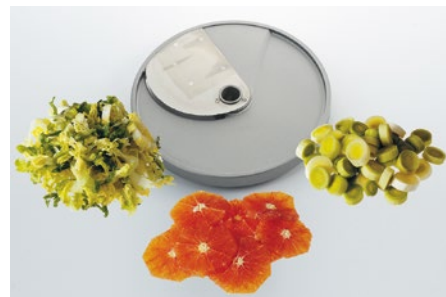
Tomatenschnitt (TO) • Coupe tomates (TO) • Taglio pomodori (TO) • Tomato slicer (TO)

G3 3 mm G6 6 mm G10 10 mm G4 4 mm G8 8 mm G12 12 mm G16 16 mm