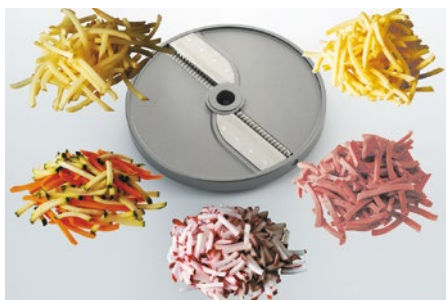
Allumettes (PA) • Fiammiferi (PA)