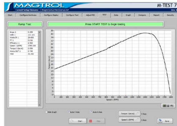
Fig.1 : M-TEST 7 Motorenprüfsoftware

Als integrierende Komponente eines der Magtrol Motorprüfsysteme vollführt die M-TEST 7-Software prüfbankoptimierte Prüfungen mit rampen- und kurvenförmigen Regelgrößen, manuelle und Pass/Fail-Prüfungen, sowie Nachlaufstests und Abschalttests bei Überlast. Mit dem