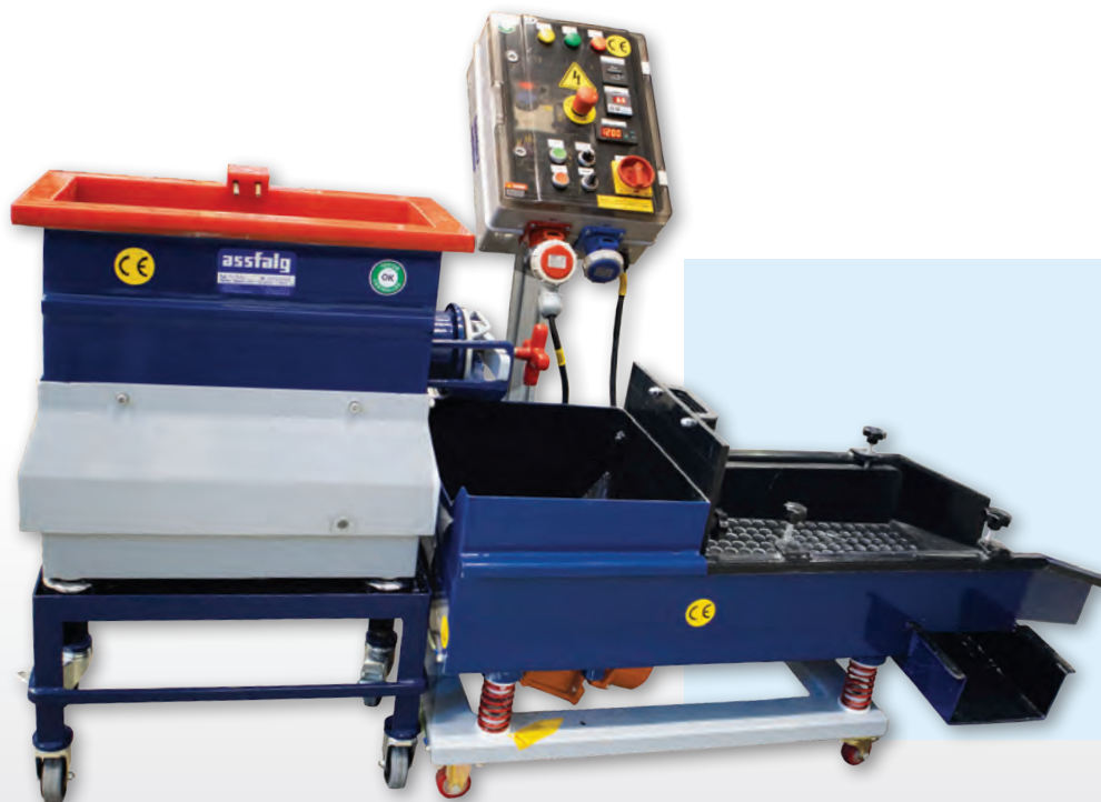
TV 15-SL mit Separator