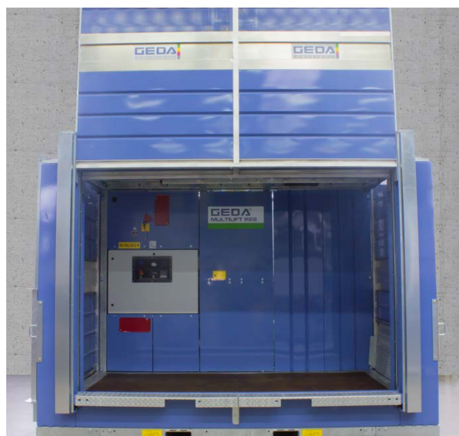
Optional: C-Türe 2,9 x 2,0 m (BxH)