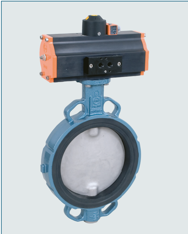
Universell einsetzbare Zwischenflanschklappe Z 011-B mit einvulkanisierter Manschette gemäß EN-593.