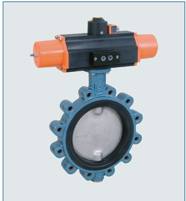
Auch erhältlich als Anflanschversion Z014-B mit einvulkanisierter Manschette.