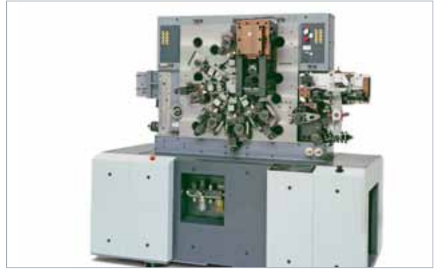
Multicenter MC 42