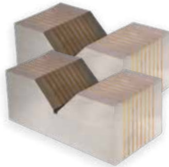
950 v Prisma