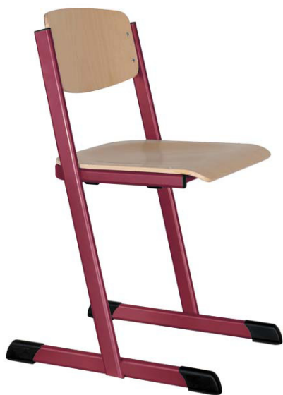
Schulstühle T-Form, offener Sitzträger