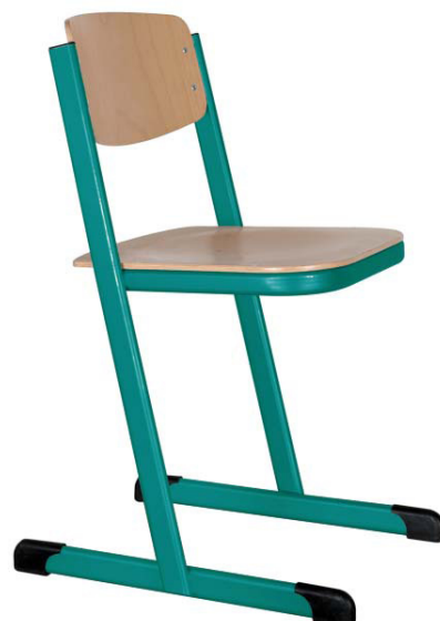
Schulstühle T-Form, geschlossener Sitzträger