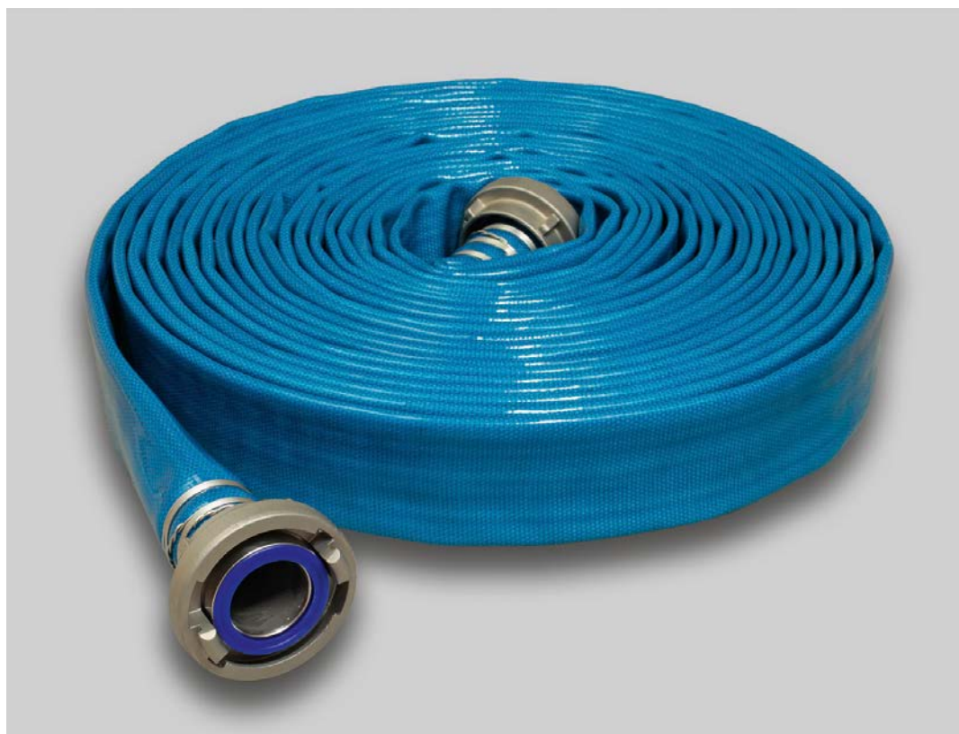
Syntex Eschbach Aquadur blau

Der Fertigungsdurchmesser des Schlauches wird durch einen Hohlkegel im Zentrum des Webringens festgelegt