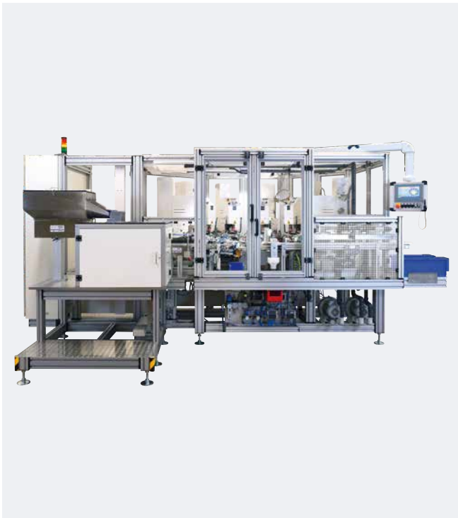
Automation 6-farbig mit RAPID 2000/60-3