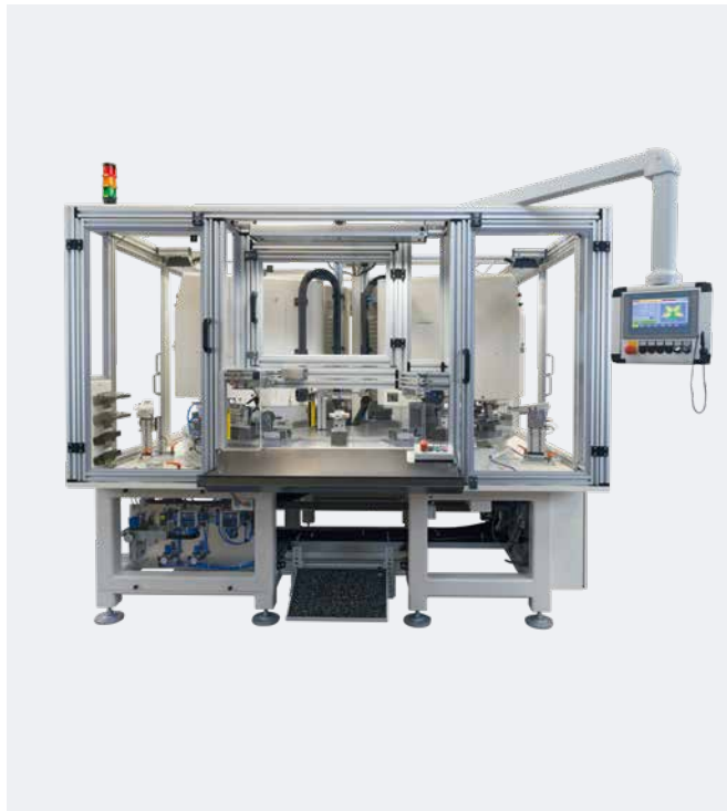
Automation 4-farbig mit HERMETIC 13-12 universal