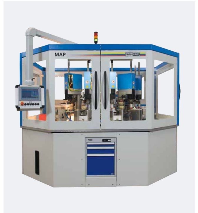
Automation MAP Variable Bestückung