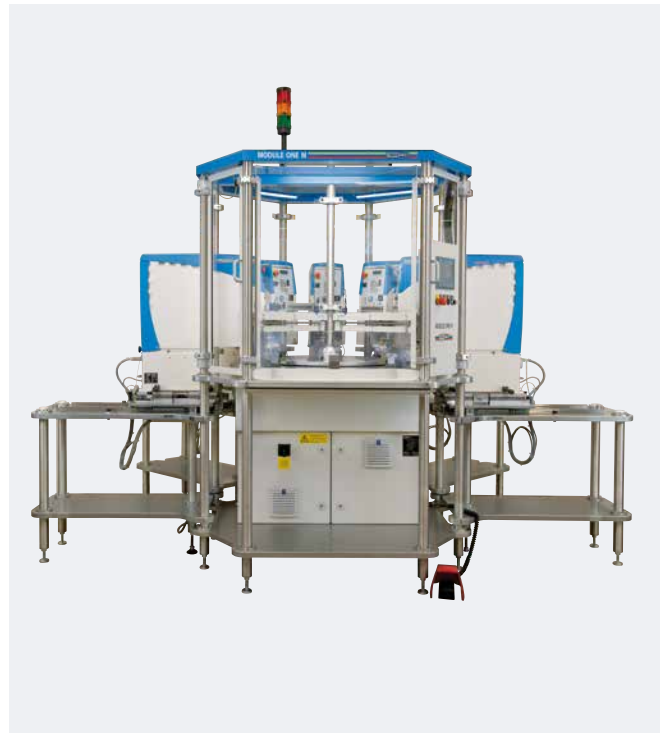
Automation 5-farbig MODULE ONE M