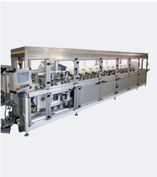
Automation 12-farbig mit RAPID 2000/1