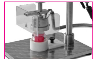
Tiegel mit Tiegelaufnahme (Sonderausstattung)