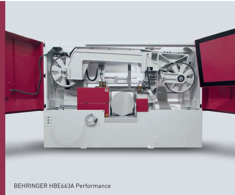
BEHRINGER HBE663A Performance