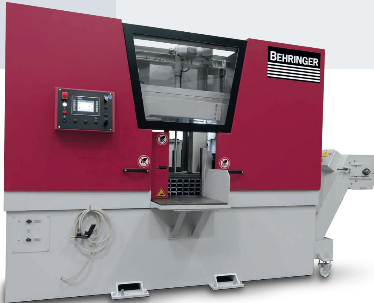
BEHRINGER HBE411A Dynamic