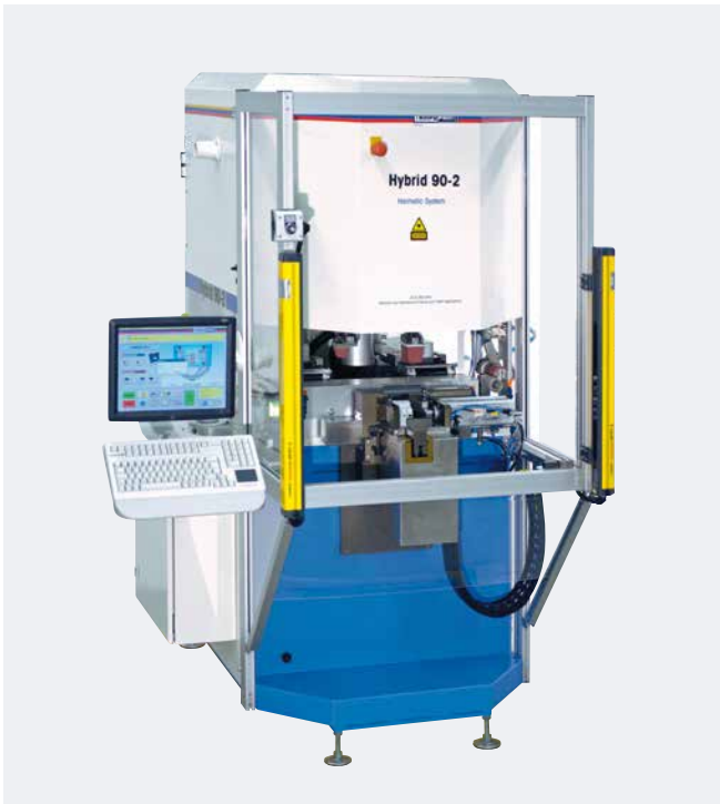
HYBRID 90-2 mit Option Lichtvorhang