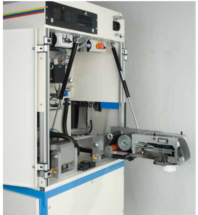
HYBRID-90-2 Schwenkbare Druckeinheit