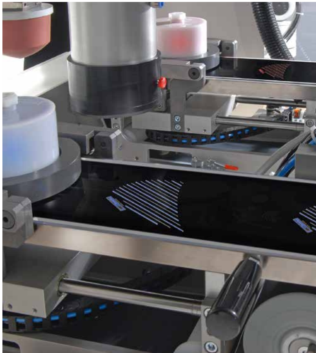
HYBRID-90-2 Integrierte Lasereinheit zur Druckklischeefertigung