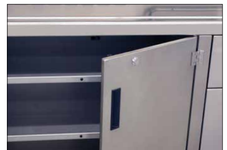
Abschließbare Doppeltüre, Tischplatte mit Ablaufrinne