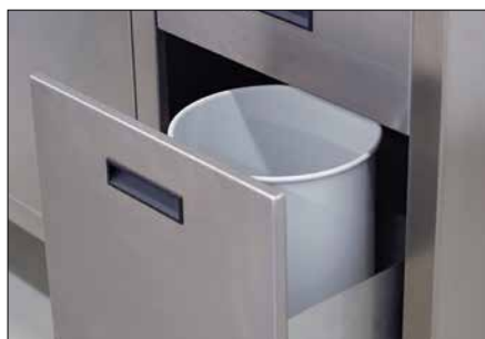
Entsorgungseinheit inkl. Abfallbehälter