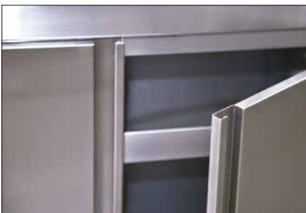
Flügeltüren mit versenkten Griffleisten