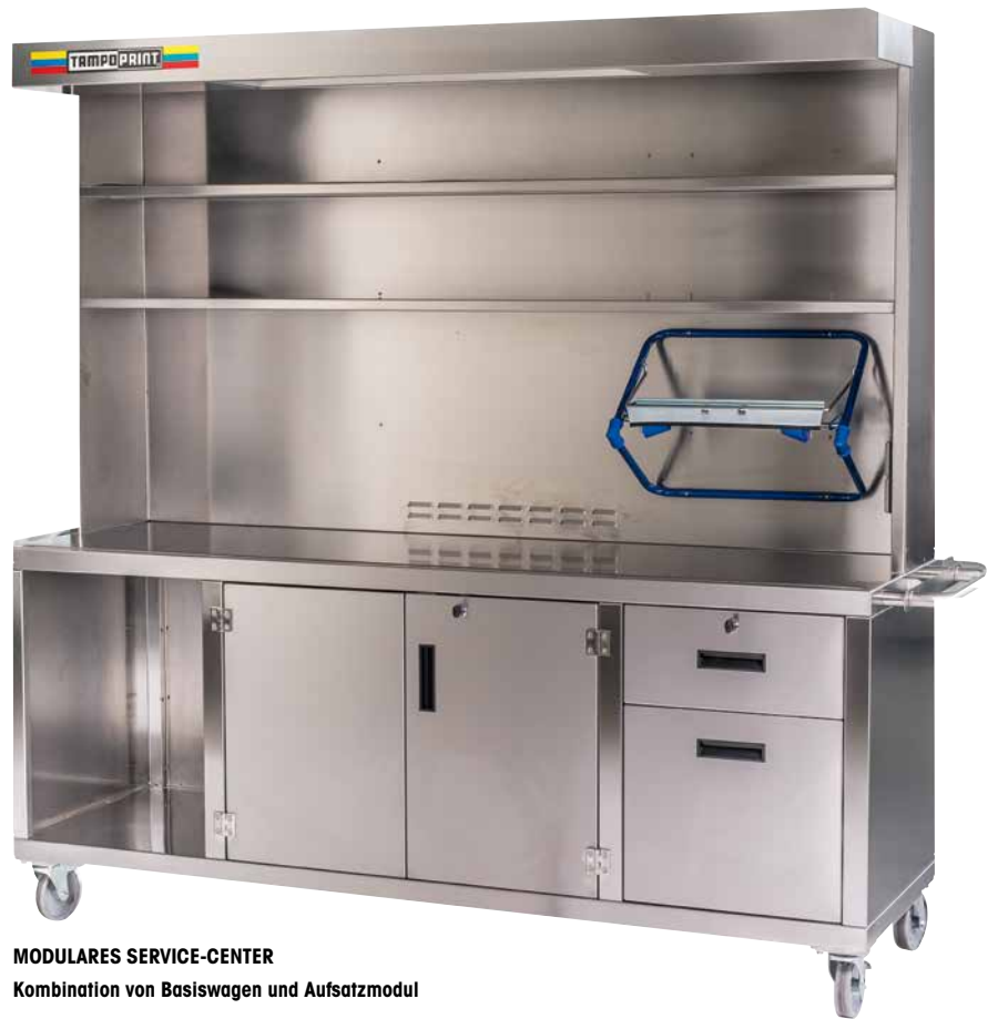
MODULARES SERVICE-CENTER Kombination von Basiswagen und Aufsatzmodul