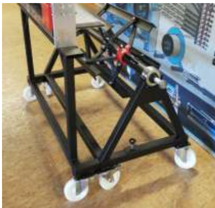
Haspel mit eingefahrener Handschere