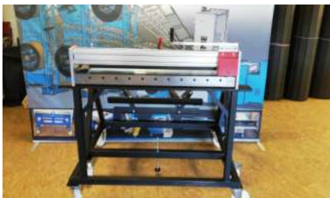
Ansicht Vorne (ausgefahrene Ansicht) mit Handschere