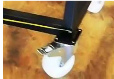
Anbaumöglichkeit für Handschere am Rahmen durch Aufnahmebohrungen und Lenkrolle mit Bremse