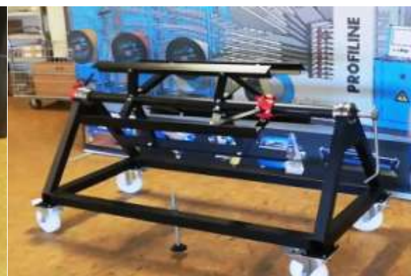
Abrollhaspel mit Handschere