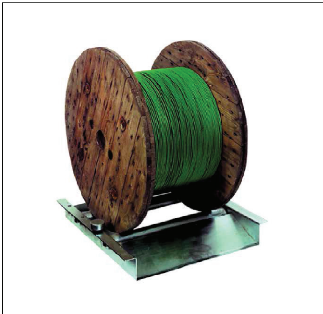
Abb. 3 TROMBOI 800