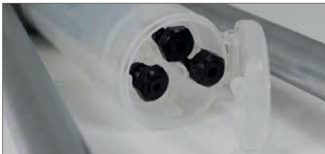
Wechselmundstücke in verschlossenem Fach am Stiftaufangbehälter.