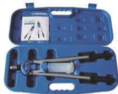
Alle HONSEL -Hebelnietgeräte werden im schlagfesten Kunststoff-Koffer geliefert.