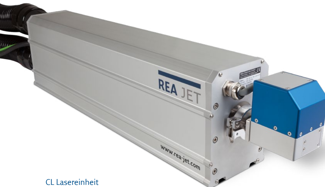
CL Lasereinheit Schutzklasse IP65