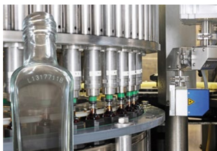
Kennzeichnung von Glas

Das einheitliche Bedienkonzept für alle REA JET Technologien.