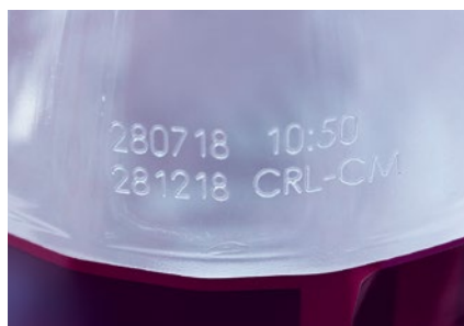
Beschriftung von PET-Flaschen