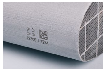
2D Code Markierung auf Rußpartikelfiltern