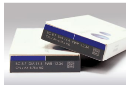
Verpackungskennzeichnung durch Farbabtrag