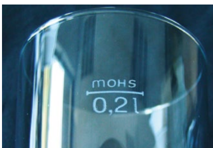
Beschriftung von Glas