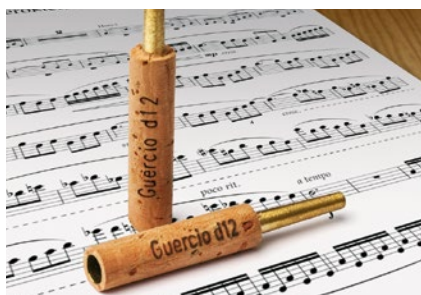
Beschriftung von Kork