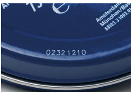
Markierung von lackierten Weißblechdosens

Das einheitliche Bedienkonzept für alle REA JET Technologien.