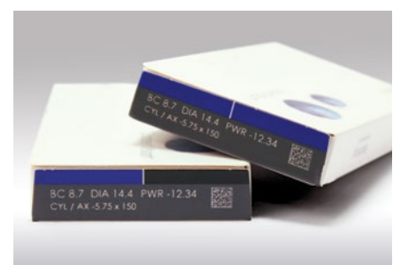
Verpackungskennzeichnung durch Farbabtrag