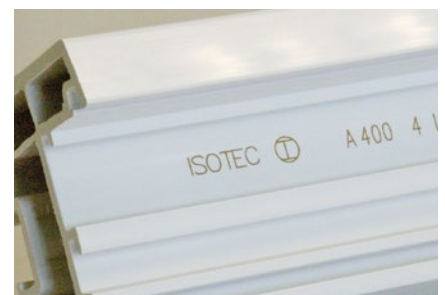
Kennzeichnung von Kunststoffen