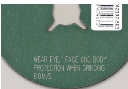
Kennzeichnung von Schleifscheiben