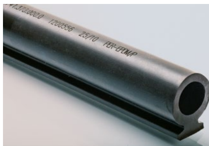
Kennzeichnung von Gummiprofilen