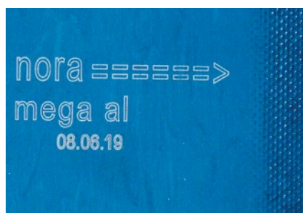
Markierung von Verbundwerkstoffen