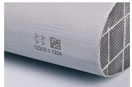
2D Code Beschriftung von Rußpartikelfiltern