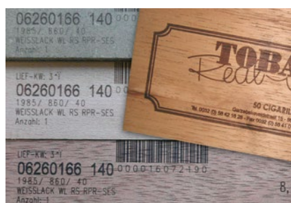
Kennzeichnung von Holzprofilen