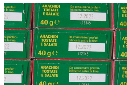
Beschriftung von Faltschachteln