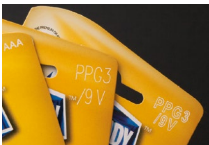
Beschriftung von Kartonagen